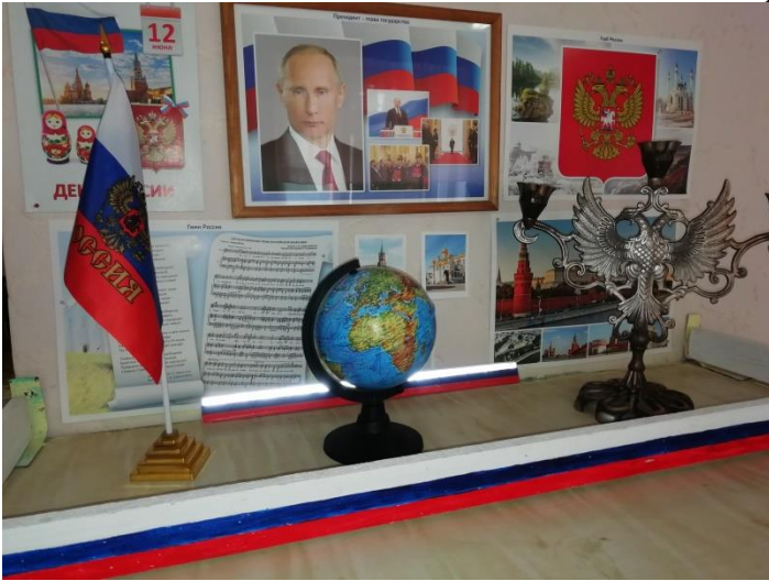
Фото центров в группе